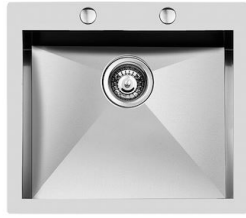
Lavello Quadra 1216 050