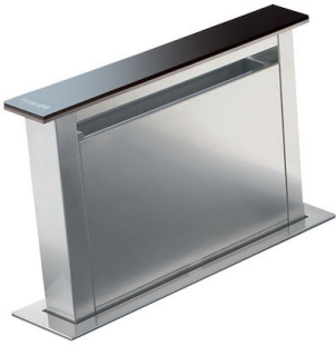
Cappa d'aspirazione S4000 Domino Ghost 2451 000